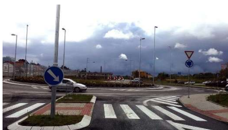
Silnice I/9, I/16 Mělník, obchvat, 1. stavba

Příklady projektů uvedených do provozu v roce 2016: