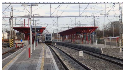
Optimalizace traťového úseku Praha Hostivař - Praha hl. n., I. část - žst. Praha Hostivař, II. fáze