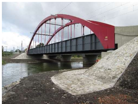
Rekonstrukce mostu v km 232,992 trati Chomutov-Cheb