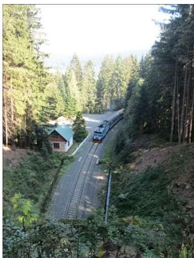
Rekonstrukce trati Klatovy - Železná Ruda – II. fáze